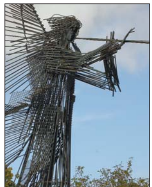
Музей під відкритим небом у центрі Чорнобиля

Таким чином, Мінсоцполітики замість розв'язан-