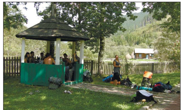
На території Перкалабського природоохоронного науково-дослідного відділення НПП «Черемоський». Тут уже облаштовано для зупинки і відпочинку туристичних груп.