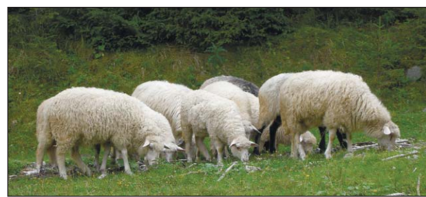
На Буковинській полонині. Напасуться віці — буде смачною бринза!