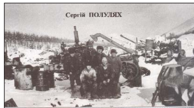
УКРАЇНСЬКА КОЛИМА (ЗАПИСКИ СТАРАТЕЛЯ)

Автор порушує, можливо, найактуальнішу тему сьогодення, а саме — недостатню увагу політиків і влади до звичайних робітників, тобто того шару нашого суспільства, без якого неможлива реалізація найамбітніших економічних чи виробничих проектів. Ми стрімко втрачаємо робітничий клас, що невдовзі обернеться втратою цілих галузей промисловості країни, якщо не ліквідацією засад державності. Власне, проблема робітничого менталітету, а саме відповідального ставлення до праці стояла ще в Радянському Союзі, особливо в деяких регіонах, у тому ж Нечорнозем'ї. Україна довго була берегинєю відповідального ставлення до праці, яке залишилося в народі у спадок від одвічних українських традицій працелюбства і пошани до землі і праці. Нині ситуація стрімко погіршується, тому автор і хоче привернути до цієї проблеми увагу широких верств суспільства, політиків та влади.