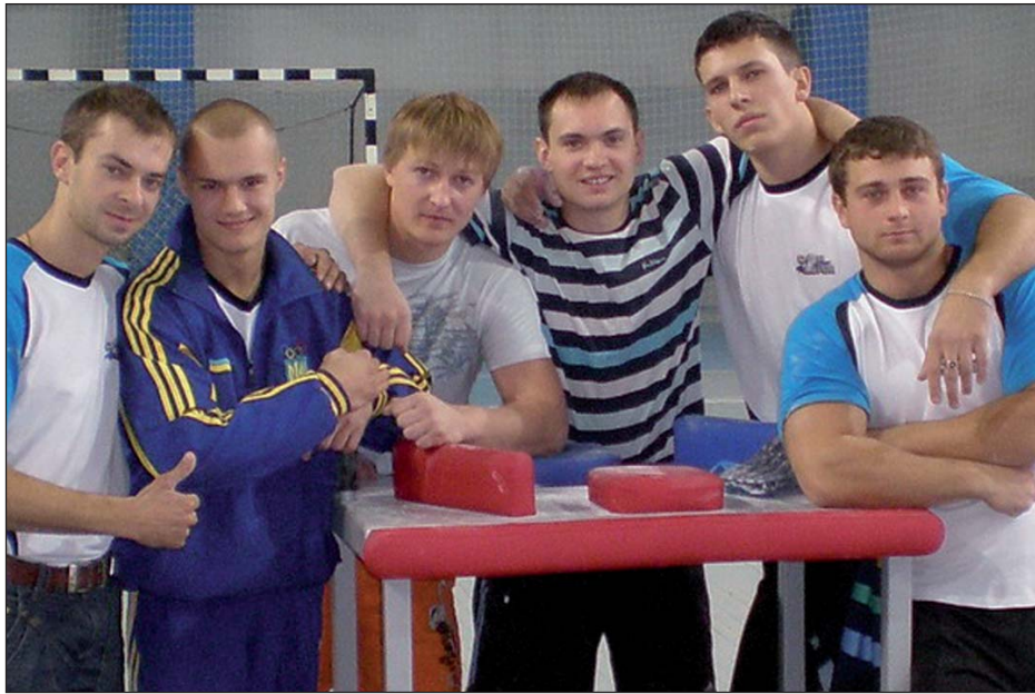
Профессионалов и любителей, чемпионов и тех, кто делает первые шаги в спорте, ветеранов, тренеров, всех, кто начинает утро с гантелей и скакалки, кому по душе здоровый образ жизни, поздравляем с Днем физической культуры и спорта Украины. Будьте здоровы и счастливы!

Совсем недавно витрина спортивных достижений НАЭК «Энергоатом», которая