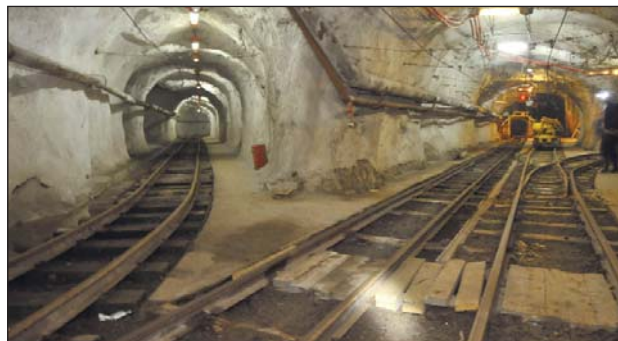
Горизонт 300 м Новокопчановской шахты

Татьяна ГОЖУЛЯНИНА, Сергей ПОЛУЛЯН