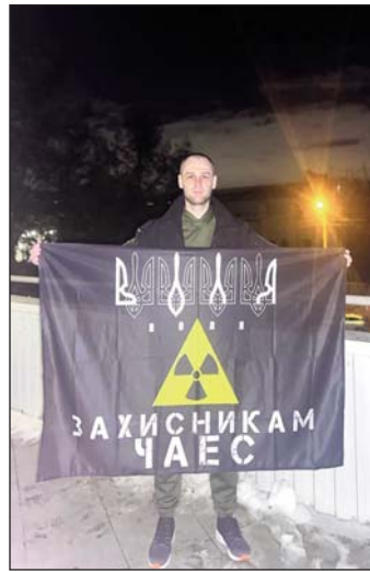
(Закінчення. Початок на 1-й стор.)

Побиття та катування Там справжнє пекло. Хлопці перебували у виправних колоніях. Всюди відеорежими та наглядачі. В камерах було по 24 людини — і нацгвардійці, і морпихи, і цивільні з Маріуполя. Не дозволяли нікуди виходити, при цьому вони мали майже весь час стояти. Не можна навіть присісти навшпиньки, бо якщо сідаєш, тебе б'ють. Через це у всіх хлопців страшний набряк ніг, хоч вони худі всі, а ноги червоні, попухлі та у виразках.