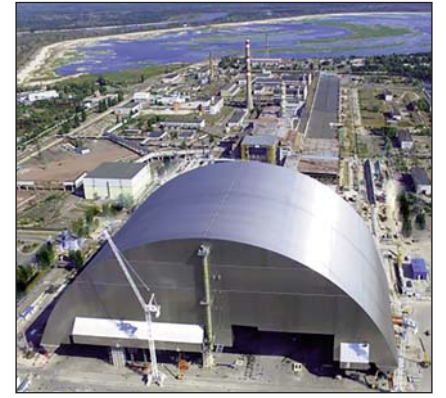
На момент закриття на ЧАЕС працювало 9000 осіб.

Після аварії, у період з 1986 по 2000 роки, Чорнобильська АЕС виробила 158,6 мільярда кВт-годин електроенергії. У до-аварійний період — з 1977 по 1986 роки — 150,2.