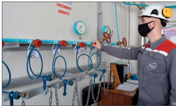
Технічне обслуговування наповнювальної рами для кисню медичного газоподібного

Отримавши фінальні узгодження, НАЕК щодо постачання