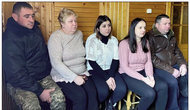
Колектив Солонечського природоохоронного відділення