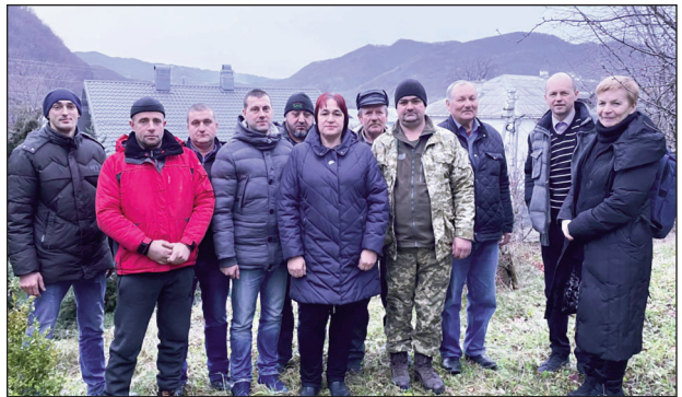
Колектив Вижницького природоохоронного відділення

Природоохоронні органи не належним чином проводять слідство, порушники залишаються поза увагою закону, а вся шкода, заподіяна навколишньому середовищу, покладається у вигляді штрафів на Парк. Це тягнеться з 2015 року і створює небезпечний прецедент, поруки лісу триватимуть, бо відповідальність за це несе тільки майстер з охорони природи, котрий працює з 8-ї до 17-ї години, у нього немає цілодобового