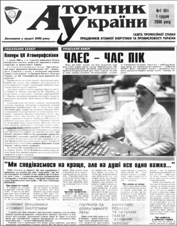
Такий вигляд мав перший номер «Атомника України»

Я хочу побажати рідній газеті завжди залишатися цікавою, актуальною, оперативною, соціальною, орієнтованою на людей газетою, яку не тільки хочеться почитати, а й до якої хочеться звернутися зі «своїм наболілим», бути своєю для кожного члена профспілки.