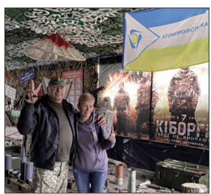
Волонтери Атомпрофспілки у музеї біля рідного прапора