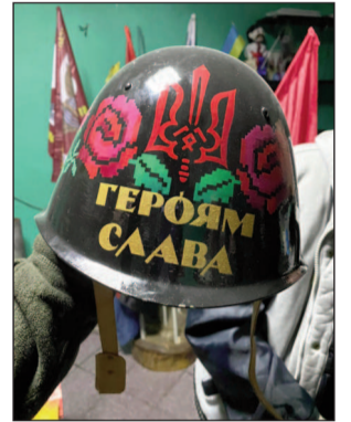
Спеціально куплена Дідом каска наповнюється цукерками для дітей, які відвідують музей

хотять рахунки за електроенергію, водопостачання. Тому за бажання і за можливості на картку (номер 4149499120138936) Наталії Карпової, дружини Анатолія Токарева, можна надіслати певну суму. Будуть вдячні!