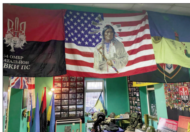
Усе в музеї — на своєму місці...

вона віддала приміщення свого кафе під експонати музею, якими він наповнюється завдяки особистим «вилазкам» Діда у зону бойових дій, завдяки побратимам, волонтерам... І документи російських найманців мали, але змушені були передати їх у відповідні органи.