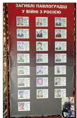
Вони загинули за Україну