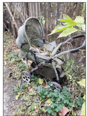
У зруйнованих «руським міром» Пісках, які нагадують чорнобильську Прип'ять

Існування профспілкового руху в Україні — це ознака рівня цивілізованості держави