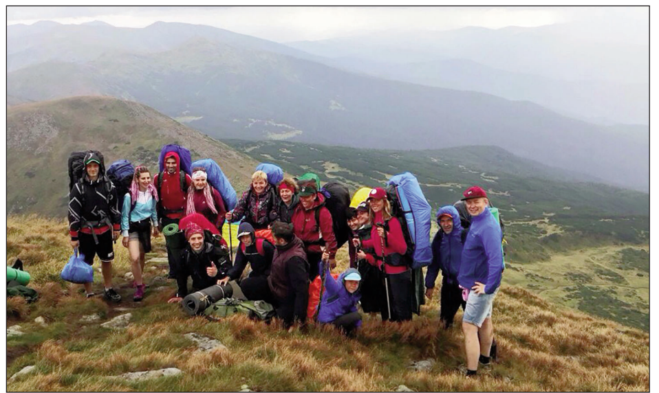
На Чорногірському хребті завжди людно

— Хотів би нагадати, що ми входимо не тільки в сім найкращих парків України,