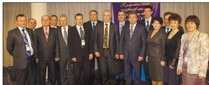
ІЗ ПОСТАНОВ В З'їЗДУ АТОМПРОФСПІЛКИ ВІД 28.03.2012 РОКУ №5-3, 5-6, 5-7, М. КИЇВ