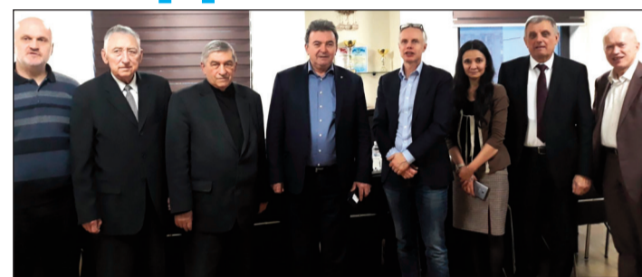
23–24 січня з робочим візитом перебував у Києві Генеральний секретар EPSU Ян Віллем Гаудріан, який зустрівся з лідерами всеукраїнських профспілок і солідарно підтримав низку вимог профспілок до української влади про відкликання одіозних законопроектів, які порушують трудові права і права профспілок

До учасників акції вийшов представник Секретаріату Кабінету Міністрів України, якому було віддано схвалену учасниками акції Резолюцію та звернення учасників акції до Прем'єр-міністра України.