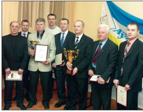
(Продовження. Початок на 1-й стор.)

Передусім, за допомогою господарських керівників — директорів підприємств і організацій, незважаючи на економічні труднощі, в галузі вдалося зберегти дві головні складові фізкультурного руху — кадри та матеріальну базу для занять фізичною культурою та спортом.