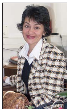
Фотограф «майстер-класу» із управління інформації РАЕС Надія ТИМОФЕЄНКО

альне житлове будівництво. Розглядається питання про відведення 120 гектарів землі під будівництво нового малоповерхового містечка.