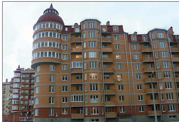
Тут живуть атомники