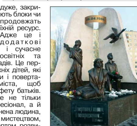
Пам'ятник ліквідаторам-чорнобильцям у Кузнецовську