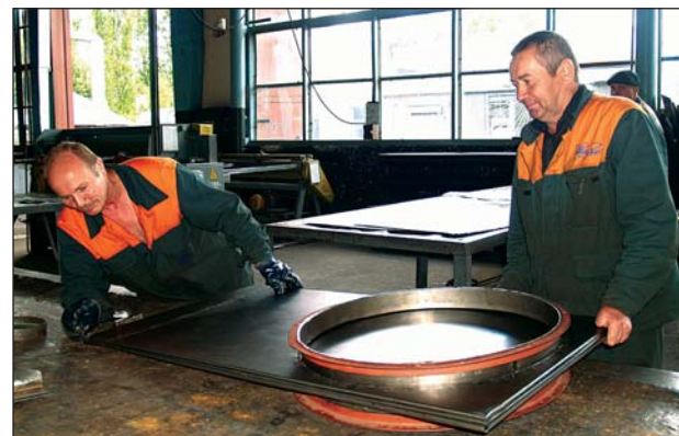
Тут «народжуються» вентсистеми