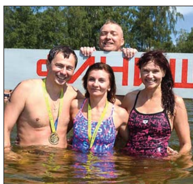
Представники Рівненської АЕС