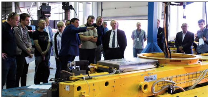
На фото: серед новітнього оснащення відокремленого підрозділу «Атомремонтсервіс» ДП НАЕК «Енергоатом» — мобільний металообробний комплекс US-3000R для ремонту високої точності ущільнюючих поверхонь реактора ВВЕР-1000

Він повідомив, що загалом, за підсумками I півріччя, Енергоатом виробив 40,2 млрд кВт-год електроенергії, що становить 101,4% планового завдання. «Найкращі показники виконання плану досягнуто на РАЕС — 102,1% та ЮУАЕС — 102%. Дуже добрі показники продемонстрував у першому півріччі «Атомремонтсервіс», який виконав план на 126%. За рахунок понадпланового виробництва та зниження витрат електроенергії на власні потреби за I півріччя 2018 року Компанією додатково отримано 382,6 млн грн товарної продукції. Частка Енергоатома у загальному обсязі виробництва електроенергії в Україні становить, за підсумками перших шести місяців 2018 року, — 50,3%, а у структурі Енергоринок — 51,6%, — зазначив президент Енергоатома.