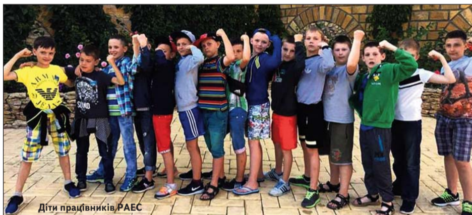
Діти працівників РАЕС

Кращі санаторії Західної України, що профілюються на оздоровленні органів