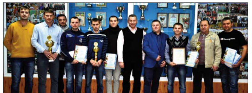
Учасники спартакіади ЕРП-2017