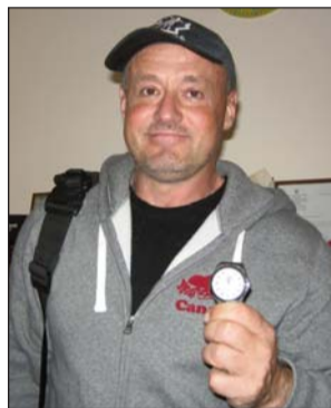
З годинником від міністра Арсена Авакова