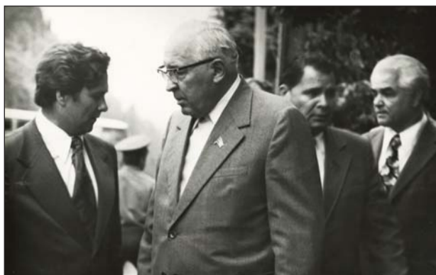
Напутствие директору от министра среднего машиностроения СССР СЛАВСКОГО Е.П.