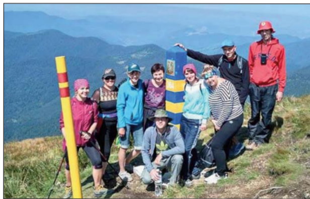
На вершині — одною ногою в Румунії...

Відсутність інформації про зроблену профспілковою організацією справу — це відсутність самої справи!