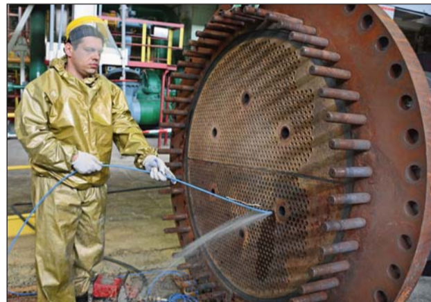
На блоках ПП 3, 4 виконуються роботи з очищення поверхонь нагріву трубних частин підігрівачів мережевої води