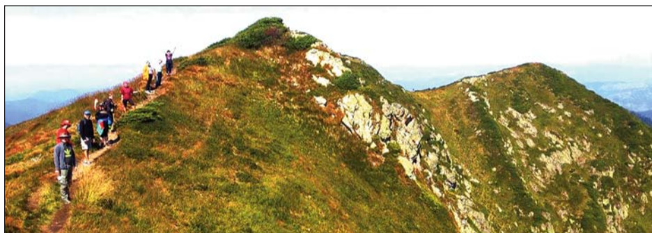
До вершини Попа Івана Мармароського зовсім близько