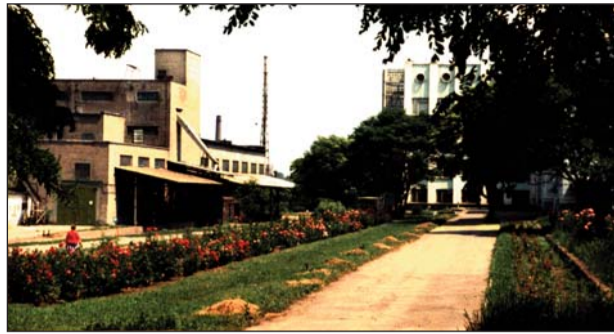
Розарий на заводе

Теперь от руководителей требовались не только организаторские способности, но