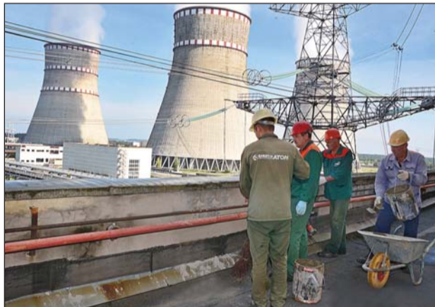
Працівники РБЦ виконують покрівельні роботи на енергоблоці П4