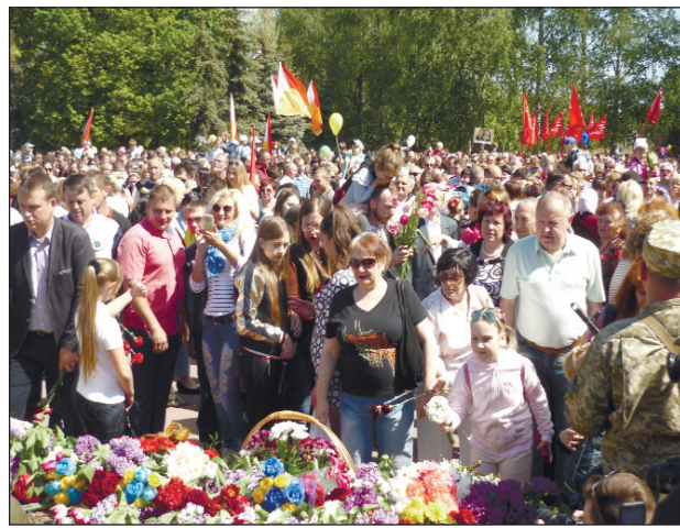
На фото: 9-те Травня — вшанування пам'яті полеглих у Великій Вітчизняній війні на меморіальному комплексі Кропивницького «Фортечні вали» за участю працівників і ветеранів Інгульської шахти ДП «СхідЗК».