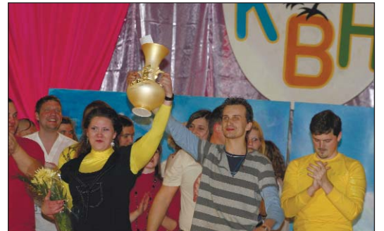
Учасники конкурсу KBK організації молоді СООП

Східна об'єднана організація профспілки починає свою історію з далекого 1952 року. Тоді вона мала назву «Груповий комітет №12».