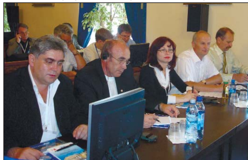
Делегація СООП на конференції у Санкт-Петербурзі