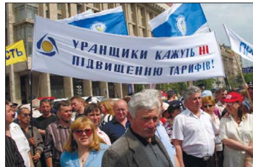
Представники СООП на акції протесту у Києві