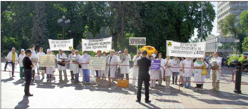
На знімках: працівники СМСЧ №16, м. Чорнобиль, пікетують Верховну Раду України, 14 липня 2016 року