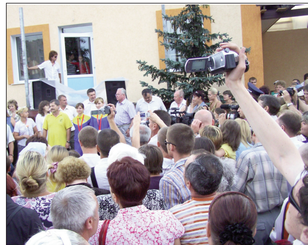
Встреча олимпийцев в Нетешине