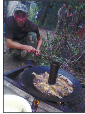
Нормальна вечеря — це коли бійці готують самі