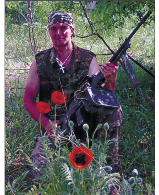
Травень. Донбас. Війна