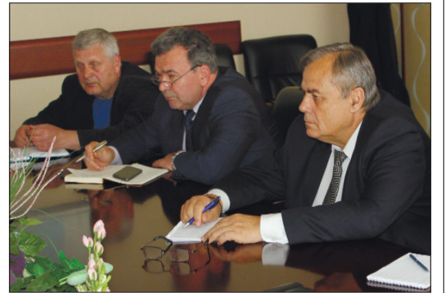
промисловості, енергетики та інших галузей (ICEM) і Міжнародна федерація працівників текстильної, швацької і шкіряної промисловості (ITGLWF).

Міжнародна федерація металістів (МФМ), Міжнародна федерація профспілок працівників хімічної і гірничодобувної