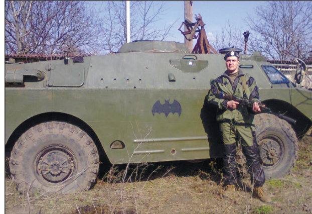
У бойову машину, подаровану підрозділу волонтерами, сепаратисти жодного разу не вцілили. І слава Богу, бо броня на ній відсутня. Зрізана башта, натомість довелось встановлювати спеціальне пристосування для кулемета