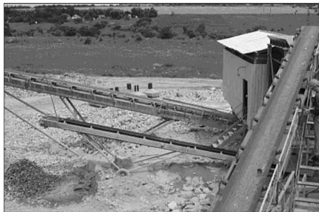
Передвижной рудосортировочный комплекс. Переработка обвалов горного производственного аппаратами «Галенит» и «Уранит»