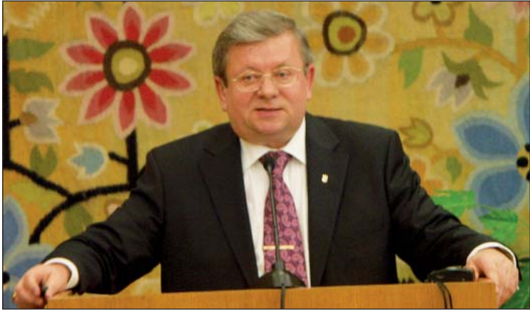
(Закінчення. Початок на 1-й стор.)

Значну увагу Компанія приділяє підготовці ліцензованого персоналу. В навчально-тренувальних центрах АЕС щорічно готуються 60–80 кандидатів на ліцензії. Відповідно до нормативних документів нині всі АЕС держави укомплектовані вісьмома змінними ліцензованого персоналу для кожного енергоблоку. Знаєте, коли я спілкуюся зі своїми зарубіжними колегами, де є такі енергоблоки як в Україні, ніхто собі, окрім нас, не дозволив мати стільки змін ліцензованого персоналу, максимум шість — це те, що практикується в Європі і загалом у світі. Також відомо, що рівень кваліфікації українських атомних фахівців високо цінується у країнах СНД. З іншого боку, дуже прикро, що за період з 1 січня 2009 року до 1 липня 2010-го від'їзд нашого ліцензованого персоналу на зарубіжні АЕС, де у два-три рази вища зарплата, становив 9,1% — це чималі втрати людських і фінансових ресурсів, пов'язаних з підготовкою висококваліфікованих спеціалістів. Тому з метою захисту гарантованого чинними нормативними актами належного (досягнутого) рівня оплати праці працівників «Енергоатома» ми нині спільно з Мінпаліверенго України вирішуємо питання про затвердження Міністерством фінансів фінансового плану Компанії на 2010 рік, де обстоюємо рівень зарплати, передбачений Колективним договором (витрати на зазначені цілі за колдоговором на 2010 рік загалом становлять 2 млрд. 397,5 млн. грн.), і працюємо вже над проектом фінансового плану на 2011 рік.