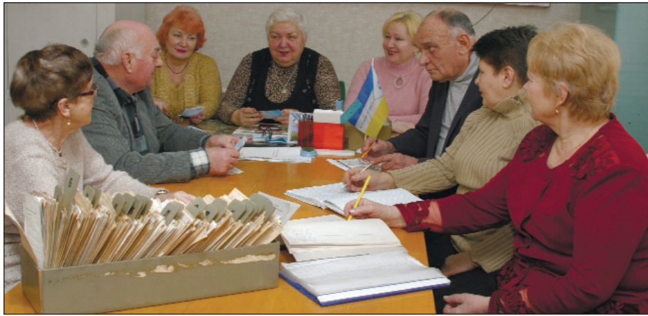
На снимке из архива комбината — актив ветеранской организации ГМЗ