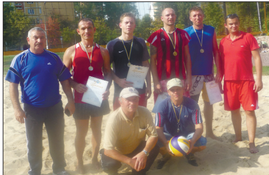
Победители турнира по пляжному волейболу