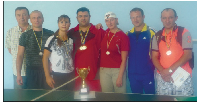
Победители теннисного турнира

Третий командный приз спортсмены Чернобыльской АЭС завоевали в турнире по настольному теннису, причем сделали они это очень уверенно — из двадцати