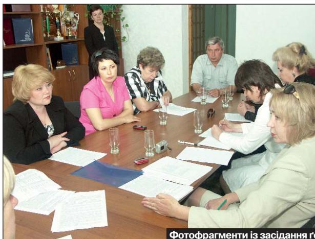
Фотофрагменти із засідання гендерної комісії ЦК профспілки