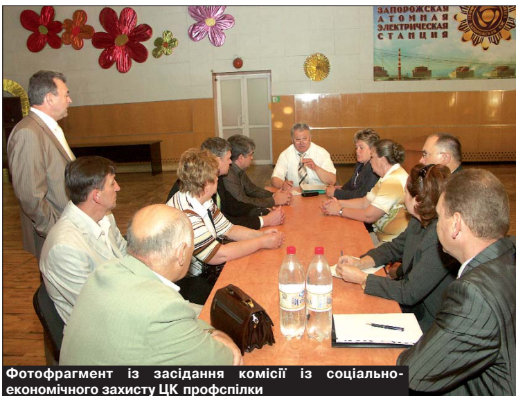
Фотофрагмент із засідання комісії із соціально-економічного захисту ЦК профспілки