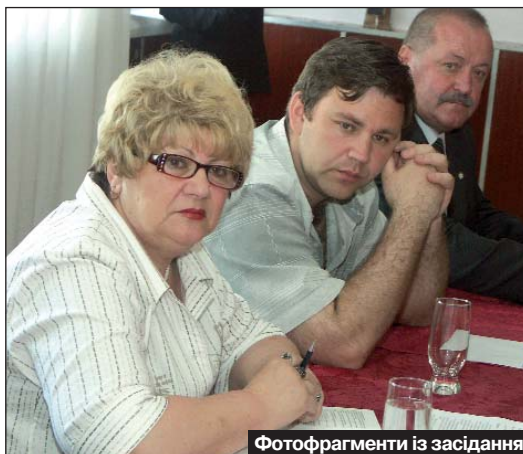
Фотофрагменти із засідання Статутної комісії ЦК профспілки