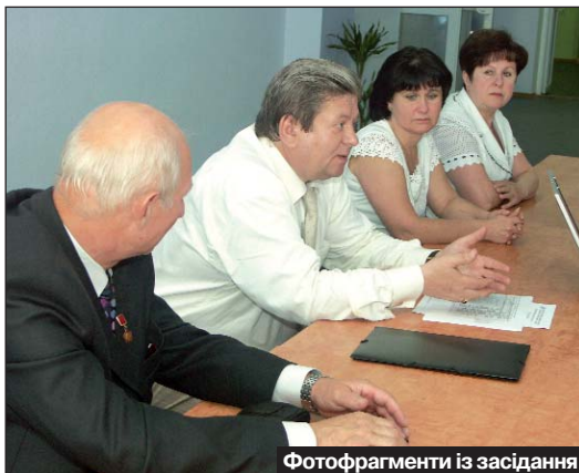
Фотофрагменти із засідання бюджетної комісії ЦК профспілки