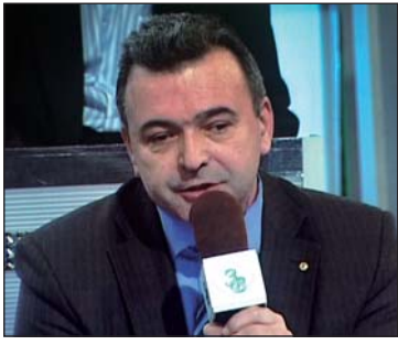
(Закінчення. Початок на 1-й стор.)

Тоді на яку відстань віднесе цю смертельну хмару? А що коли у результаті повені вода зміє радіоактивні відходи, які масово, без спеціальних технологій, захоронені біля річки Прип'ять, що впадає у Дніпро — головну водну артерію України? Це дедалі більше нагадує гру у російську рулетку. Багато хто нині у світі думає, що в Україні нічого серйозного не сталося, а причиною короткої тривалості життя громадян держави є пияцтво і наркоманія. Та об'єктивна реальність зовсім інша. Щорік кількість хворих на рак киян і опромінених українців тільки зростає. Нині таких хворих в Україні близько 165 тисяч. За розрахунками спеціалістів з Міністерства охорони здоров'я, у 2020 році їх буде близько 200 тисяч. Експерти кажуть, що основне зростання захворюваності після ядерних катастроф відбувається через 25—30 років. Отже, можливо, скоро розповіди про мутантів серед новонароджених перестануть бути лише страшними казочками на ніч.