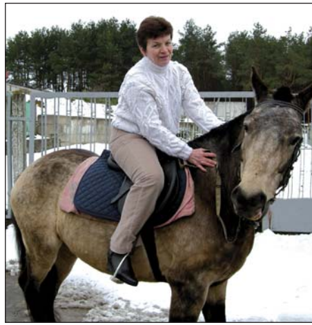
На лагідній конячці Розі можуть спокійно покататися всі бажачі, переконана кореспондент «АУ»