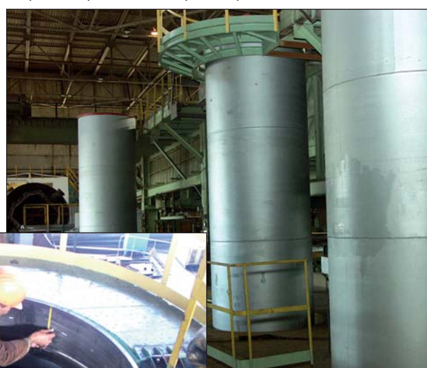
На знімку: у 2002 році завод НСОІТ розпочав реалізацію спільного українсько-американського проекту — серійний випуск контейнерів для сухого зберігання відпрацьованого ядерного палива (СЗВЯП). Сьогодні підприємство виготовляє щомісяця 1—2 контейнери СЗВЯП, для пріоритетних потреб ЗАЕС, повністю з вітчизняних матеріалів

виробництва, контролює температурний і митний режим, освітленість і запиленість на виробництві. І самих працівників це дуже мобілізує у плані наведення чистоти і порядку на своєму робочому місці й навколишньому просторі. До 15 років. Для дітей заводчан від 6—10 років закуповуємо також недорогі путівки у так звані пришкольні табори відпочинку на 21 день, заїзди у червні та липні.