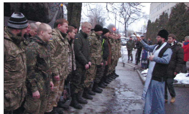
Нехай береже вас Бог, захисники України!

Закуплені речі разом з маскувальними халатами, сітками, продуктами харчування від чернігівського обласного волонтерського центру, який працює при військоматі, було завантажено в автобус, що перевозив бійців з ротації у зону бойових дій. Священик української православної церкви благословив усіх бійців, вручив їм іконки-обереги.