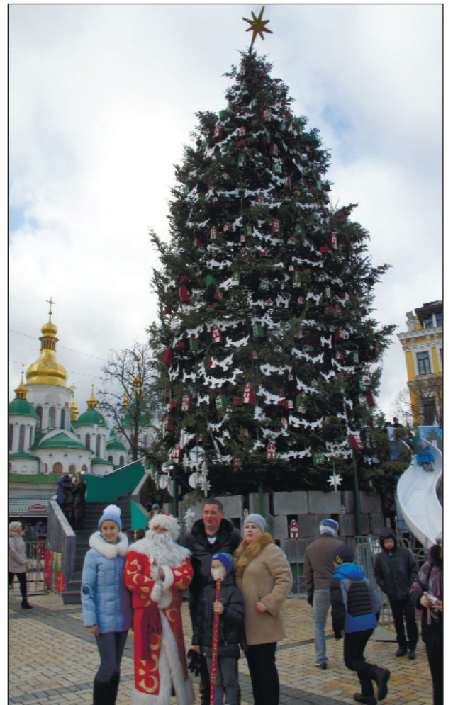
Ялинка-2015 на Софійській площі у Києві

Оздоровление работников и членов их семей. Сравнительный анализ обеспечения путевками персонала ЭРП в 2013—2014 годах показывает, что количество санаторно-курортных путевок необходимо увеличить. Не все работники, которые нуждаются по заключению акта медосмотра, рекомендациям врачей, а главное, хотя бы пройти курс лечения в профильных санаториях, могут это выполнить из-за нехватки санаторно-курортных путевок. (Окончание на 2-й стр.)