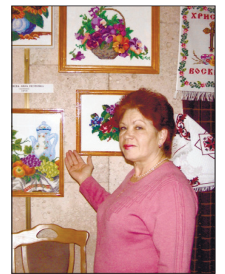
Ветераны-аматоры сцены и умелые рукодельницы и их сотоварищи — благодарные ценители самодельного творчества

раз был в больнице, мы ему стараемся чем-то помочь, и то, что на 1000–1500 гривен там прокапаться, это нам возможно. Знаете, если бы нам каким-то путем решить вопрос медицины... Бизнеса в городе стало много, аптек на каждом шагу, а цены на лекарственные препараты очень высокие. К примеру, у меня муж диабетик, если я недавно покупала ему лекарство за 90 гривен, то сейчас — 180 гривен, мигом все подорожало не на проценты, а в разы. Сегодня один наш человек находится на лечении в Киеве, ему одна ампула, а для всего курса лечения надо не менее 6, обходится в 15 тысяч гривен.