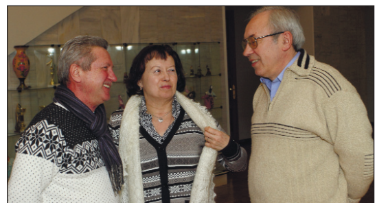
Встречи ветеранов, людей, готовых в беде подставить товарищу свое плечо