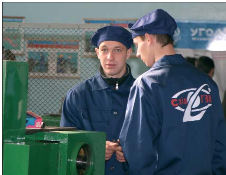
Робочі будні СхідГЗК. Номінація „Гімн праці”