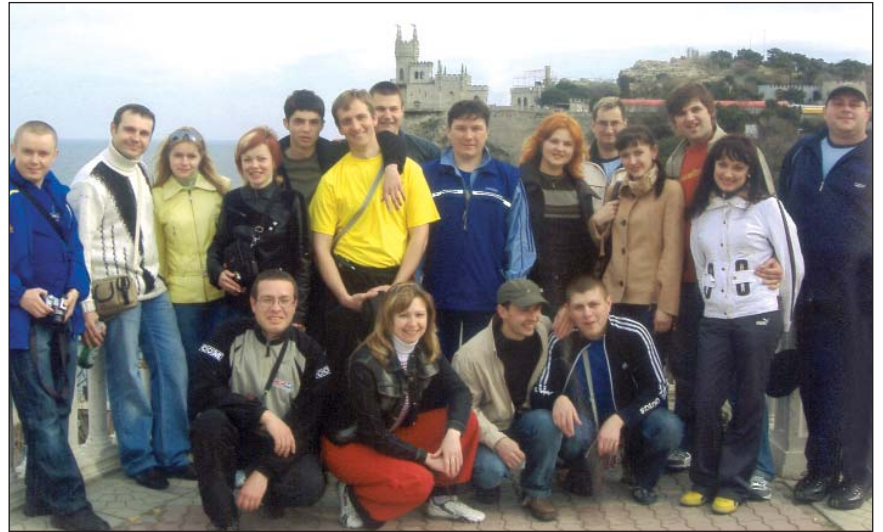
Учасники III з'їзду Спілки молоді Атомпрофспілки України, який відбувся у квітні 2007 року у с/мт Лівадія, неподалік пам'ятки архітектури Ластівчине гніздо». Номінація Люди і колективи Атомпрофспілки»