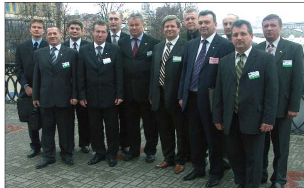
На знімку: делегати з'їзду від Атомпрофспілки

5 квітня у Міжнародному центрі культури і мистецтв профспілок столиці відбувся V з'їзд Федерації профспілок України. Майже 700 делегатів представляли 44 всеукраїнські профспілки, в яких нараховується близько 11 млн. членів профспілок. Відкритим голосуванням головою ФПУ було обрано Олександра Юркіна.