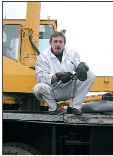
На знімку: ліворуч водій-кранівник транспортного цеху ХАЕС; праворуч — філін-пугач (занесений до Червоної книги України). Його було піймано в районі об'єкта «Укриття» майже десять років тому. Знімок неодноразово використовувався у засобах масової інформації без посилання на автора. Номінація Гімн праці»