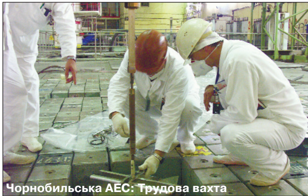
Чорнобильська АЕС: Трудова вахта

Рішення, прийняті на профспілкових зібраннях, було донесено Раді директорів підприємств і організа-