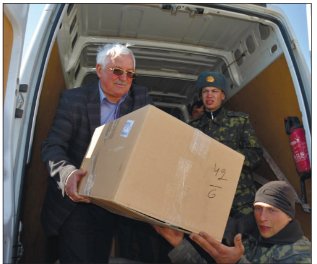
Не залишаються байдужими до сьогоднішньої ситуації на сході країни члени колективу Южно-Українського енергокомплексу. З березня 2014 року атомники проводять централізований збір коштів для допомоги Збройним Силам України.

Пункти прийому гуманітарної допомоги знаходяться в школах міста та в міському товаристві Червоного Хреста.