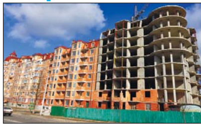
Дванадцять сімей працівників Рівненської атомної електростанції покращили свої житлові умови. Урочисте вру-

чення ключів від квартир та ордерів на отримання безплатного житла з вторинного ринку відбулося 30 квітня у міській раді за участю представників адміністрації та профспілкового комітету ВП РАЕС.