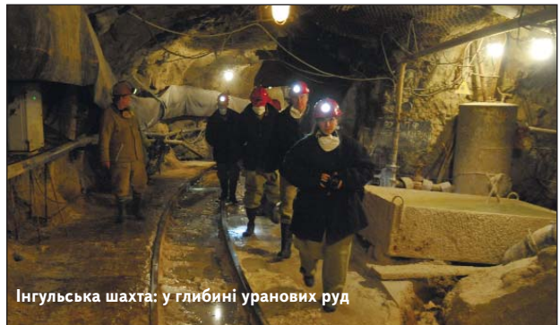
Інгульська шахта: у глибині уранових руд

СОЦІАЛЬНІ ПАРТНЕРИ ЮЖНО-УКРАЇНСЬКОЇ АЕС: ОБЛИЧЧЯМ ДО ЛЮДЕЙ ПОВАЖНОГО ВІКУ