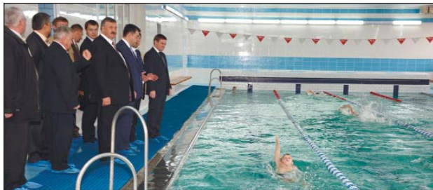
Відремонтований басейн «Енергетик» Рівненської АЕС