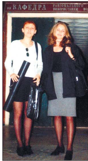
С подружкой Женькой на кафедре

Как-то, опаздывая на лекцию, Селезень прибежал весь запыхавшийся. Мы стоим перед закрытой аудиторией.