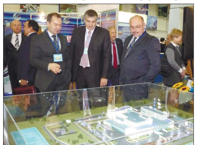
Большой интерес вызвал макет будущего завода по производству ядерного топлива

Государственное предприятие «Восточный горно-обогатительный комбинат» за участие в XI Международном форуме «Топливо-энергетический комплекс Украины: настоящее и буду-