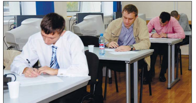
Теоретическую часть конкурса выполняют инженеры группы контролирующих физиков