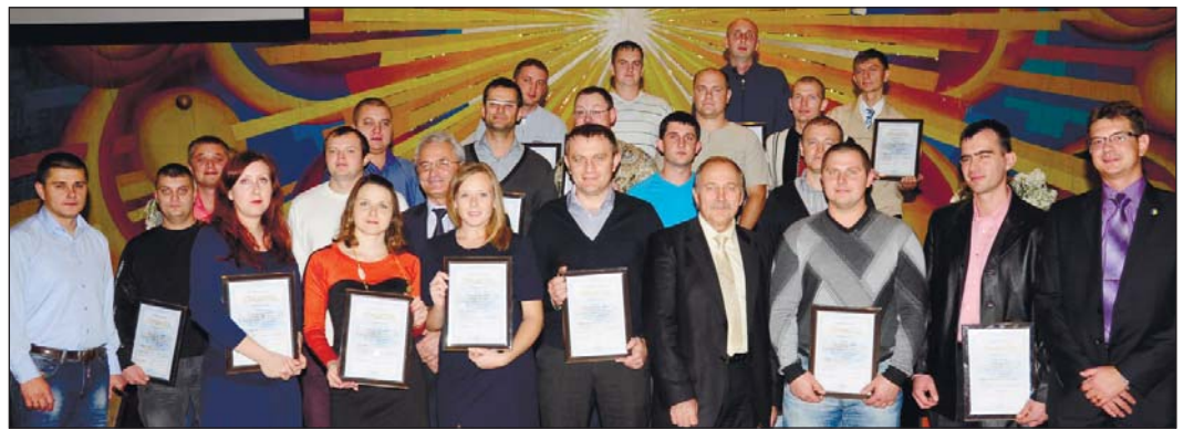
Фото на память: призеры конкурса

Нельзя сказать, что среди профессий, представленных на конкурс в этом году, одни были сложные, а другие более простые — каждая имеет свои нюансы и особенности. Хотя конкурсный