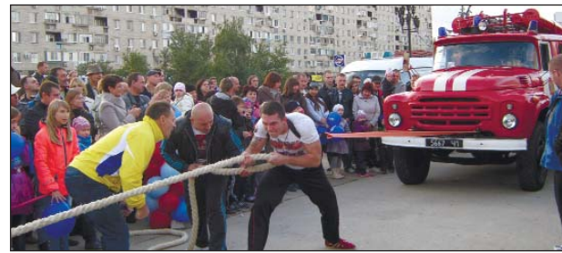
Пожарная машина «покорилась» богатырю