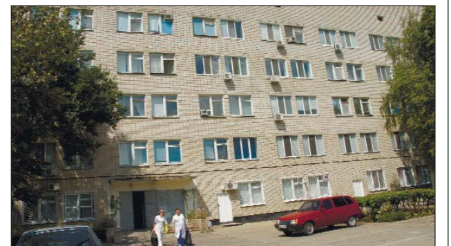
Поликлиника для взрослых