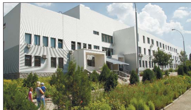
Экстерьер детской поликлиники