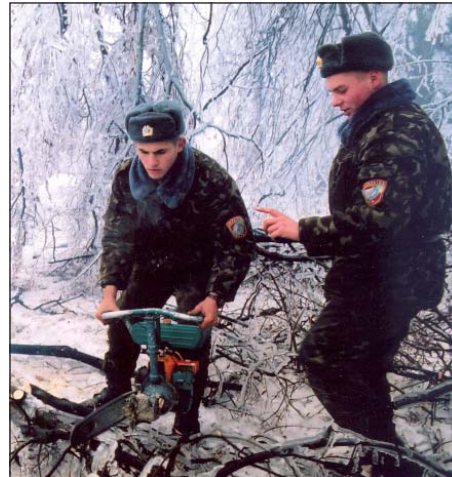
Рятувальники МНС за роботою в зоні стихійних лих.

Новостворена структура була чіткою та зрозумілою. Основні акценти було зосереджено на запобіганні надзвичайним ситуаціям (НС), на терміновому реагуванні на виникнення НС, ефективному втручанні та управлінні ліквідацією їх наслідків, со-