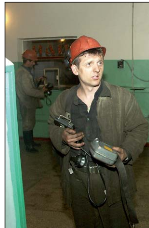
Горняки — трудовая элита предприятия

В этом году предприятие более уверенно работает, выходим с планами по