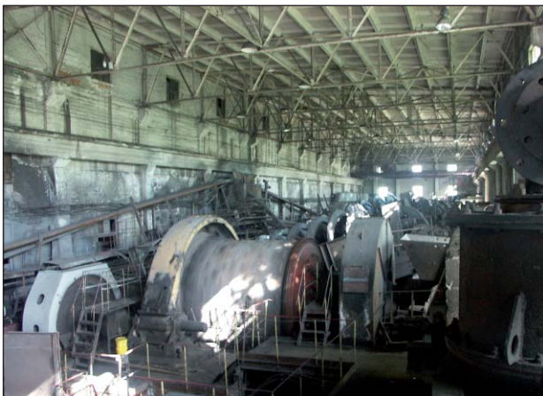
Панорама дробительного цеха фабрики

людей. Не будет профсоюза — никто с ними не будет считаться.