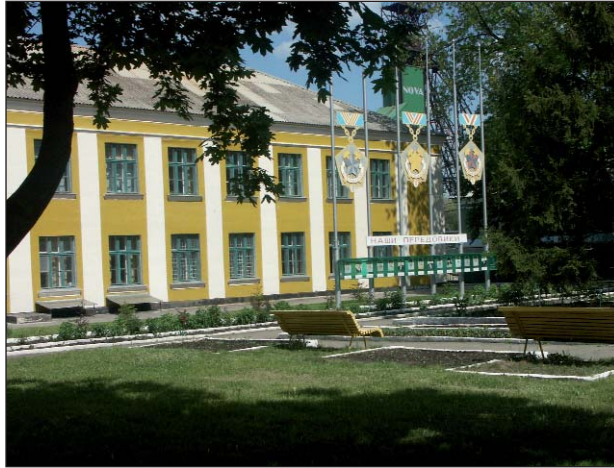
В народе говорят, что хорошего хозяина видно еще с «порога». У входа и на территории «Восток-Руды» тотчас замечаешь не парадную, а постоянно поддерживаемую чистоту и порядок, зеленое убранство промзоны

На предприятие я пришла инспектором по соцвопросам в 2004 году. В течение полугода тогда поменялось три председателя профкома, которые в основном сетовали на нехватку свободного времени и нервность такой общественной