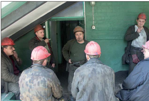
Перекур после подземной вахты