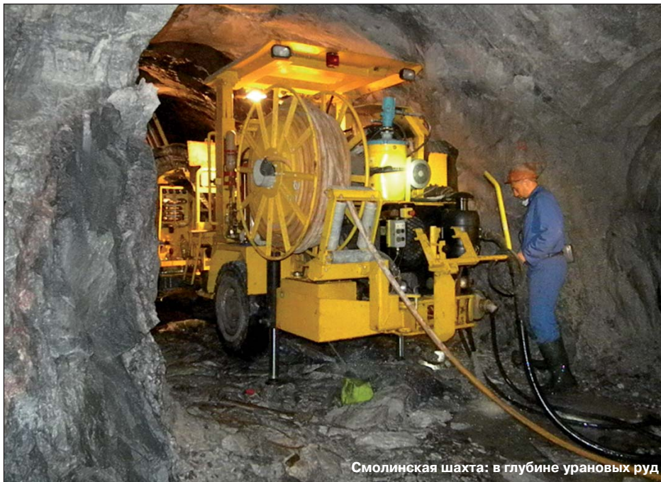
Смолинская шахта: в глубине урановых руд

Не менее важной проблемой летней оздоровительной кампании уже третий год остается комфортная доставка детей работников шахт в лагерь, а самих работников шахт и членов их семей — на базы отдыха. Эта проблема уже озвучивалась на конференциях. Отделом транспорта профкомом дан ответ о целесообразности установки дорогостоящих кондиционеров (цена порядка 135 тыс. грн.) на автобусы со сроком эксплуатации более 4-х лет. В сложившейся ситуации, наверное, единственным правильным решением будет приобретение комбинатом новых комфортабельных автобусов с кондиционерами на каждую из шахт. И очень хотелось бы, чтобы в следующем году и дети, и взрослые ехали отдыхать с комфортом.