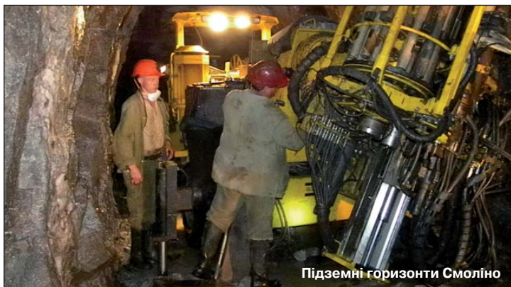
Підземні горизонти Смоліно