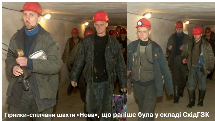
Гірники-спілчани шахти «Нова», що раніше була у складі СхідГЗК

День шахтаря для трудівників уранових шахт цього року особливий. Їхнє професійне свято збіглося у часі з 60-річчям від дня утворення державного підприємства «Східний гірничо-збагачувальний комбінат». Навіть за людськими життєвими мірками це не так багато, але за період існування комбінату було побудовано десятки величезних підприємств, виростили цілі міста і житлові мікрорайони, і, взагалі, з'явився невідомий донедавна провідний сектор економіки України — атомно-промисловий енергокомплекс. І створено це, зокрема, й руками та розумом працівників ДП «Східний ГЗК». Звичайно,