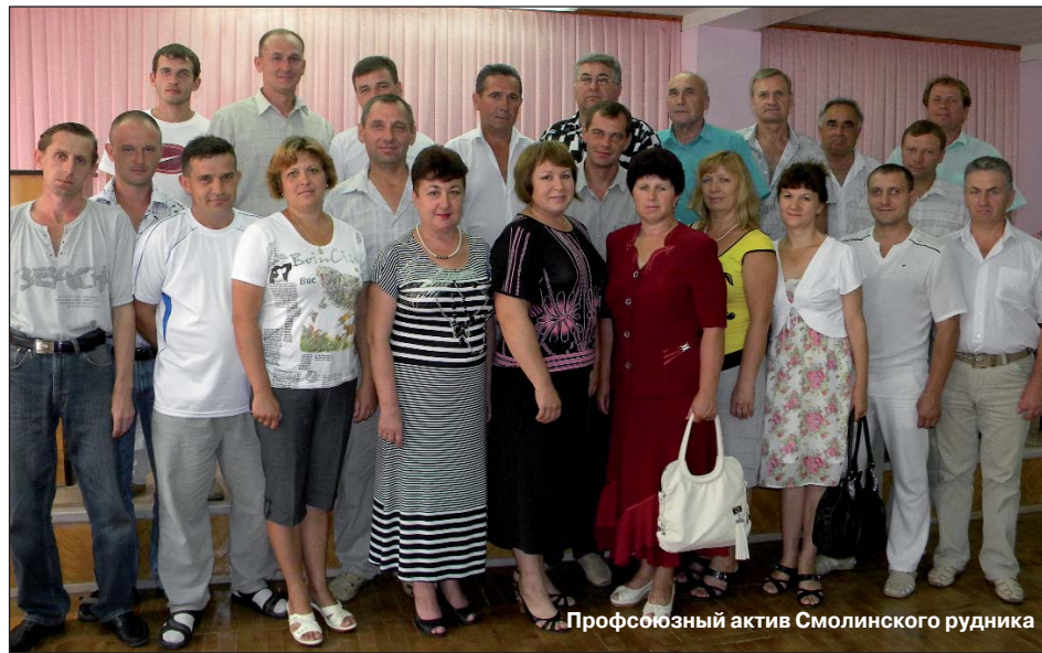
Профсоюзний актив Смолинського рудника

● 31 січня 2011 року набрав сили закон, яким внесено зміни до чинних законодавчих актів. Зокрема, у сфері державного управління: Законом України «Про внесення змін до статті 10 Закону України «Про державні нагороди України» встановлено почесне звання «Заслужений гірник України».