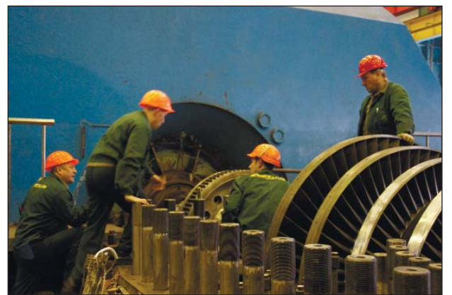
Турбинный цех №1: высокое ремонтное «напряжение»

— Я выпускник Черниговского технологического института, сейчас это уже университет, закончил кафедру «оборудование и технология сварочного производства». Но еще на третьем курсе, это был 1995 год, один из преподавателей сообщил нам, что Чернобыльская атомная электростанция, в частности, цех централизованного ремонта, приглашает желающих поехать туда работать. На тот момент не думалось, что окажусь в атомной энергетике, потому что те чернобыльские «атомные» события 1986 года несли много негативной информации. Тем более что подвержены этой радиационной стихии были и мы, пострадавшие от Чернобыля, черниговчане. Вскоре приехал в институт начальник ЦЦР ЧАЭС, встретился также и с выпускниками, которые заинтересовались данной проблематикой, открыто ответил на различные наши вопросы. Прельстили — зарплата, жилищный вопрос, в том числе и меня, еще студента, согласился сюда на работу. Поехали впервые на один месяц на практику. Потом начальник цеха говорит: «Ребята, если вы хотите, можете поработать у нас целые каникулы — с июня по пер-