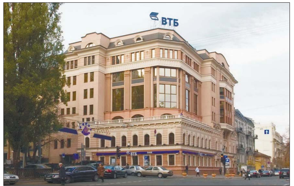
Головний офіс ВТБ Банку, м. Київ

Як правило, для людей є дуже важливою сума кредиту, яку вони