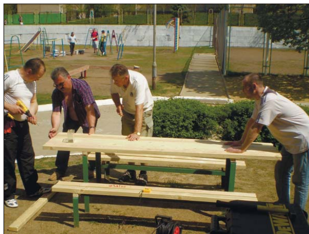
Працівники цеху майструють стіл для своїх маленьких підшефних

ФАХІВЕЦЬ ПРОПОНУЄ: ДО УВАГИ КЕРІВНИЦТВА ДП НАЕК «ЕНЕРГОАТОМ» ТА МІНЕНЕРГОВУГІЛЛЯ