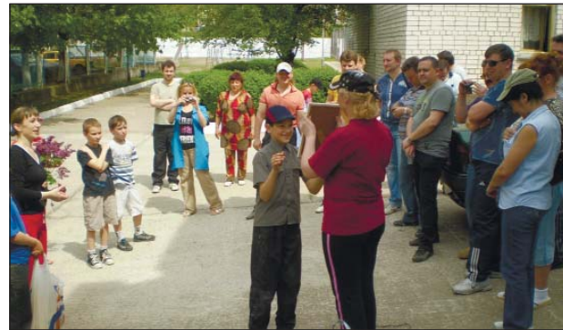
Найдороща подяка — від дітей