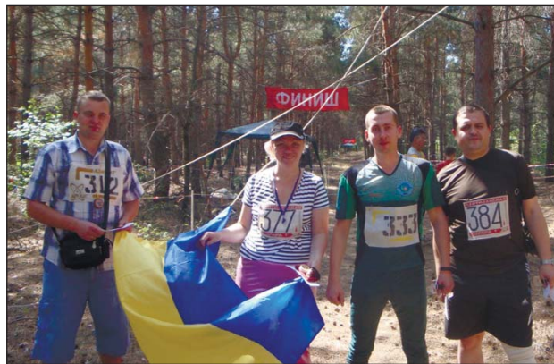
Команда цеху із спортивного орієнтування