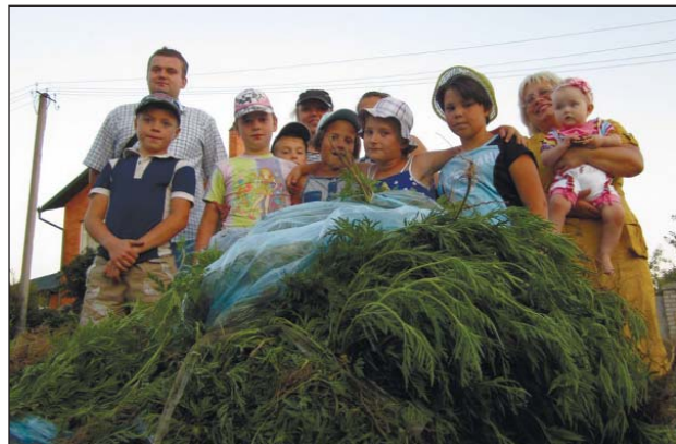
Усі — на боротьбу з амброзією

АТОМПРОФСПІЛКА БАГАТОГАЛУЗЕВА: 7 КВІТНЯ — ДЕНЬ ГЕОЛОГА